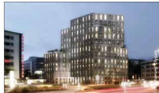
Das Citygate wird gebaut