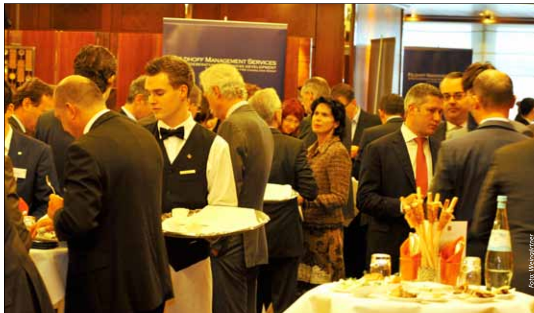
Bei Mittags- und Kaffeepause blieb viel Zeit für Gespräche

„Die Anfänge Stuttgarts“ von Hartmut Schäfer. Erschienen im Belsler Verlag, ISBN 978-3-7630-2610-8, 128 Seiten mit 150 farbigen Abbildungen für 29,95 Euro.