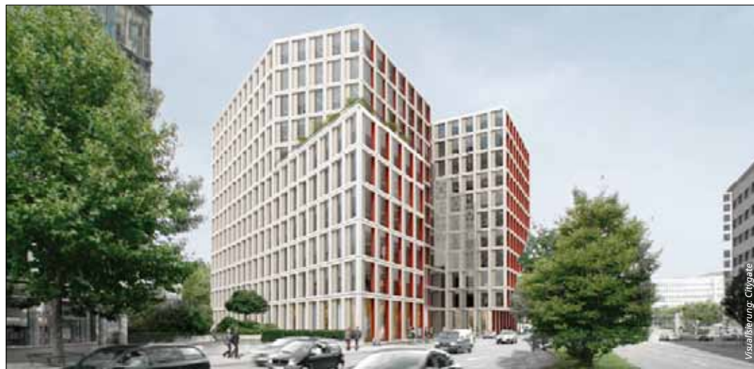
Zentraler Standort gegenüber dem Hauptbahnhof

Im Herbst 2014 soll das Citygate von Carlyle bezugsfertig sein. Der Fokus liegt momentan auf Mietverträgen zwischen 1500 und 3000 Quadratmetern. Punkten will das Bürogebäude gegenüber dem Stuttgarter Hauptbahnhof mit hochwertiger Architektur, sehr guter Ausstattung, einem Gold-Zertifikat und Blick auf die Weinberge.