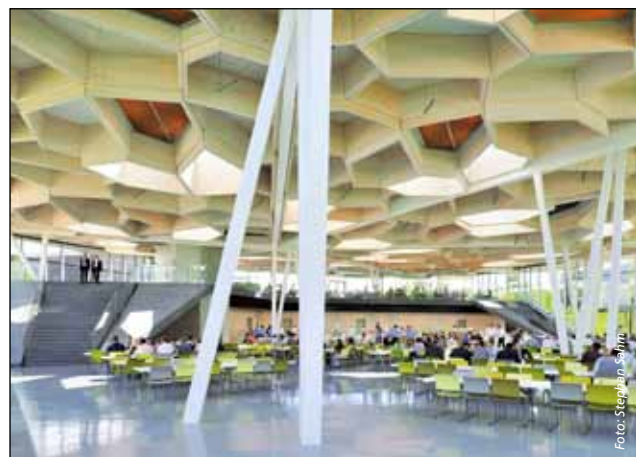
Einen Großen Hugo bekam auch das Betriebsrestaurant von Trumpf